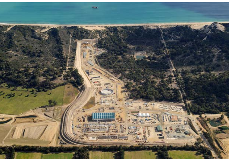
Southern Seawater Desalination Plant, Perth (Australien)