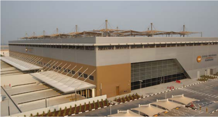
Duty Free Warehouse, Doha (Katar)